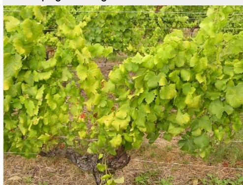
Sur cépage Sauvignon Blanc