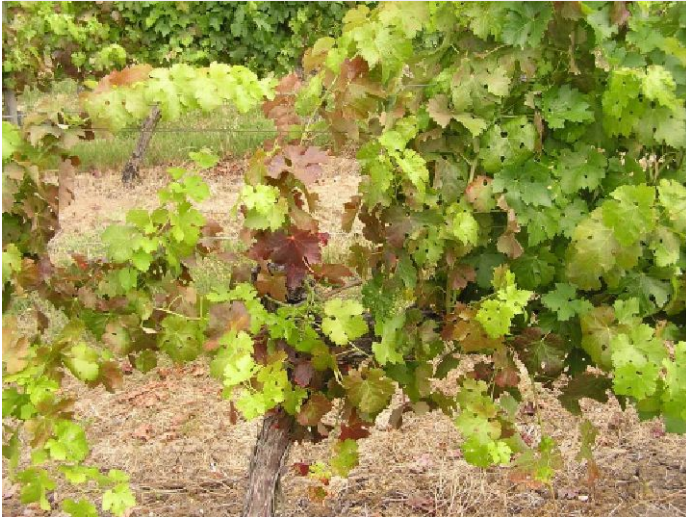
Sur cépage Cabernet sauvignon