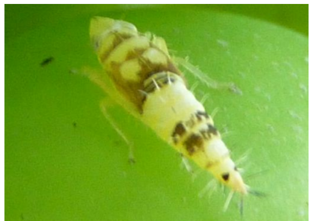
5 ème stade L5, larve jaune avec des tâches brunes (5 mm)