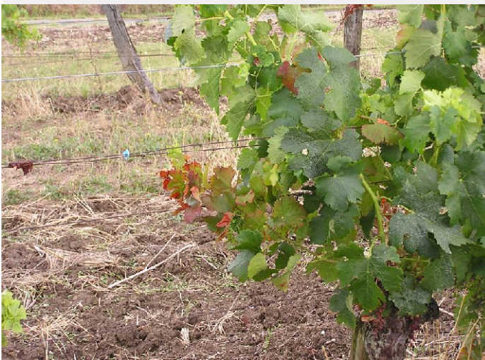
Sur cépage Merlot