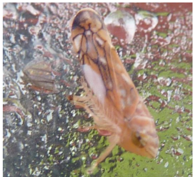
Adulte Scaphoïdeus titanus sur un piège