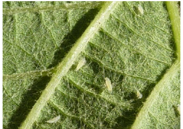
2 ème et 3 ème stades L2 et L3, larve blanc/jaune clair (2:3 mm)