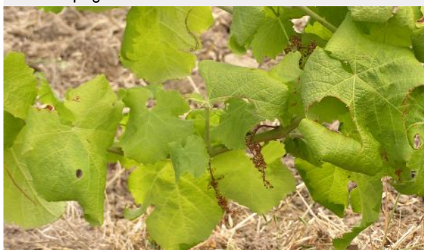
Sur cépage Muscadelle

> Symptômes sur cépages blancs : décoloration, enroulement, port retombant et grappes se desséchant, non aoûtement Sur cépage Sémillon