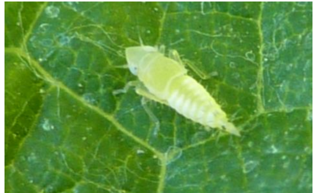
4 ème stade L4, larve jaune (4 mm)